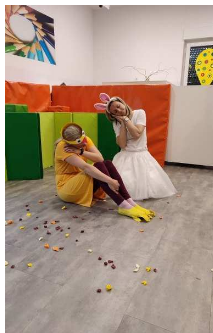
Predstava „Izgubljeno Pile“

Eko tim je tijekom pedagoške godine vrijedno kroz igru osmišljavao i izrađivao poticaje i aktivnosti vezane uz odgoj za održivi razvoj podjednako i u jasličnim i u vrtićnim skupinama. Osim uređenja i provedbe projekata, djeca i odgojitelji Eko tima aktivno su boravili u vrtićkom povrtnjaku, a uz ekološki uzgoj plodova u povrtnjaku i voćnjaku organizirali su posjet lokalnom opg-u istraživačkog sadržaja. Osim izleta, posjeta farmi i događanja, eko tim je bio zaduženi i za svakodnevnu organizaciju boravka djece na svježem zraku te organizaciju različitih,