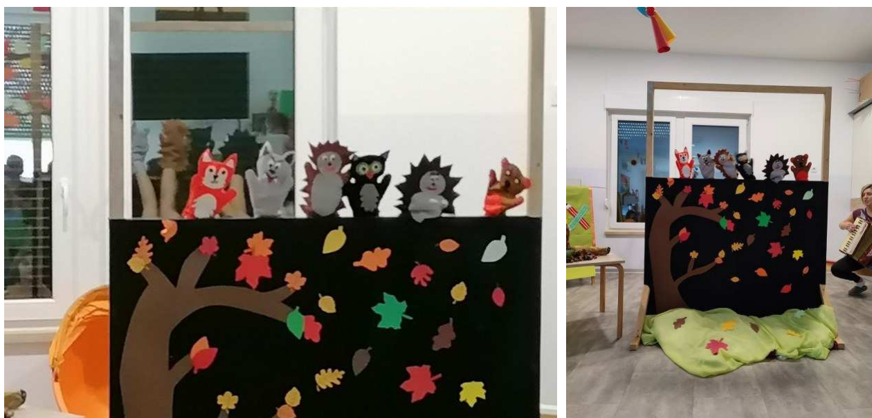
Predstava "Jesenski kaputić malog Ježa"

Dramski tim osmislio je i realizirao mnogo predstava tijekom ove pedagoške godine za djecu vrtićke i djecu jasličke dobi u izvođenju i organizaciji odgojitelja. Osim čestih kraćih lutkarskih predstava i dramatizacijskih scenskih igara, odgojitelji su pripremili tri glavne predstave na razini ustanove i to povodom Jesenskih svečanosti, Svetog Nikole i Uskrsa.