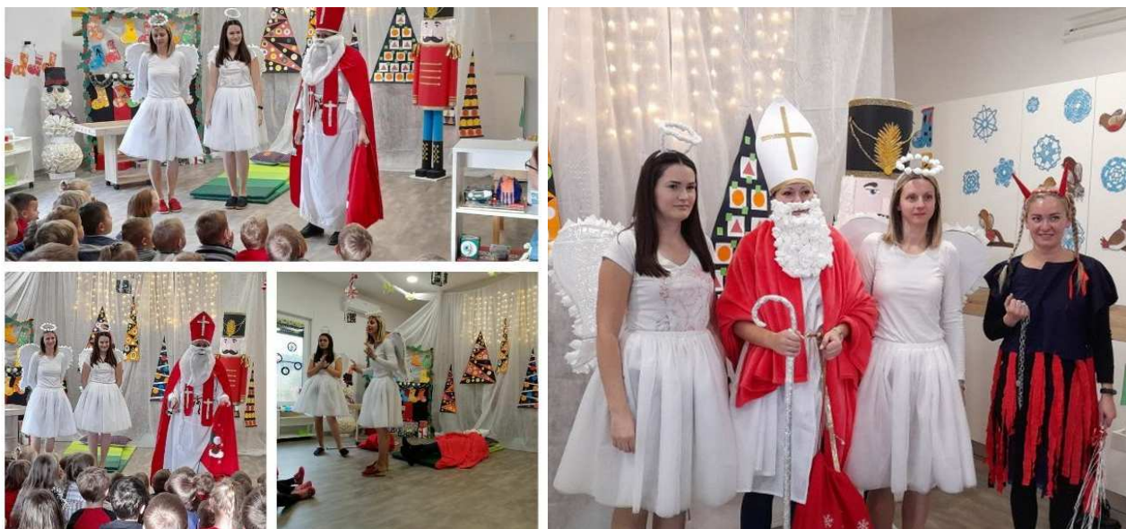
Predstava "Uspavani Sveti Nikola"